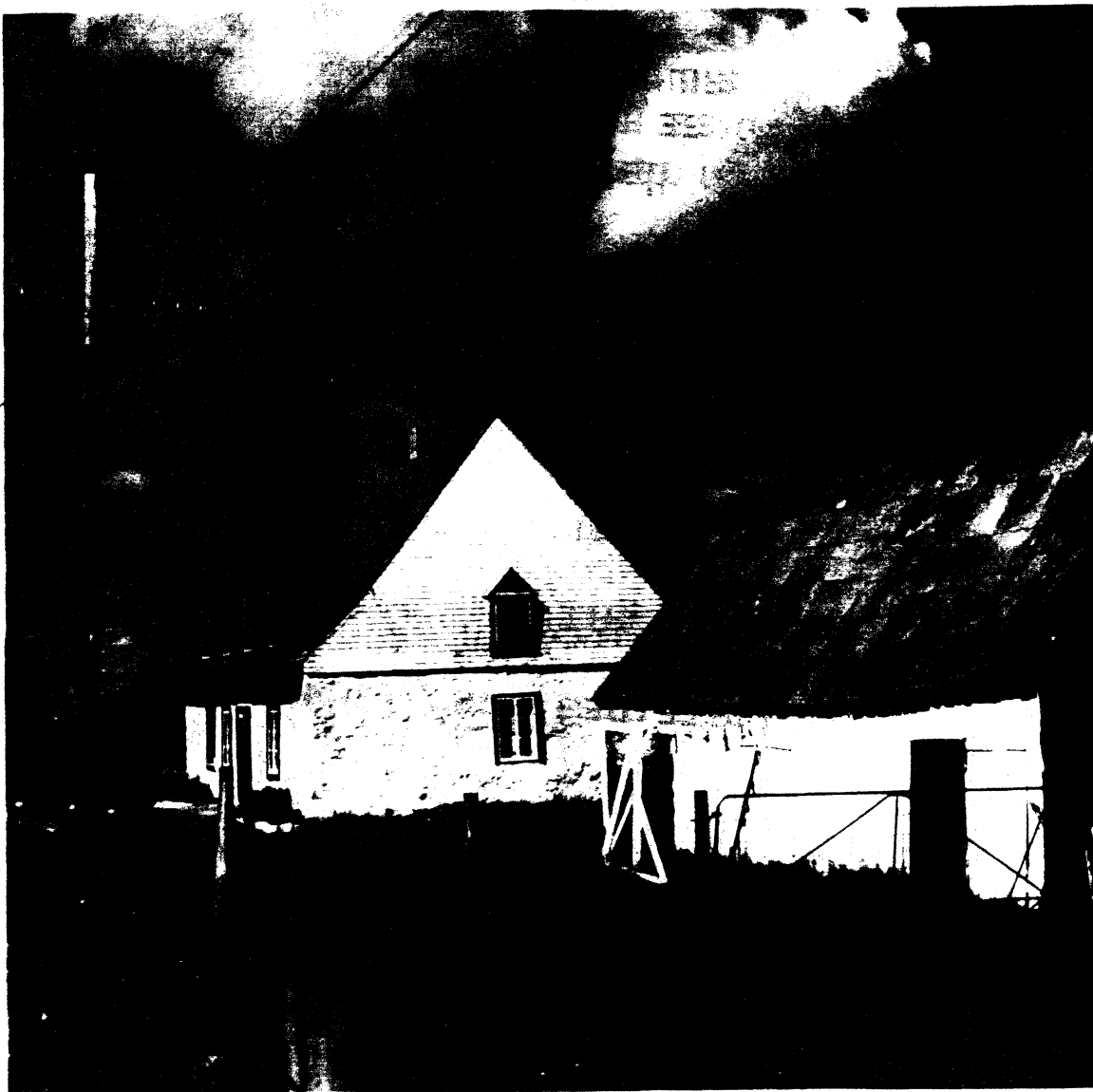
MAISON LACOURCIERE A BEAUMONT