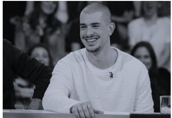
Emmanuel Dubois « Koriass » lors de son passage à Tout le monde en parle .

Le passage du rappeur Koriass à l'émission télévisée Tout le monde en parle il y a quelques mois n'a laissé personne indifférent. Celui que l'on qualifie parfois de rappeur enragé, s'est particulièrement illustré par sa prise de position concernant la violence faite aux femmes et par son appui au mouvement féministe. Il s'est mérité en particulier l'éloge de l'une des participantes à cette émission, Madame Lise Payette qui semblait très émue et impressionnée suite à l'intervention du jeune rappeur sur un sujet aussi délicat et présentée dans un langage très posé et avec beaucoup d'assurance et d'aplomb.