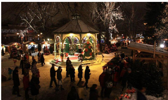
Marché de Noël et des Traditions de Longueuil