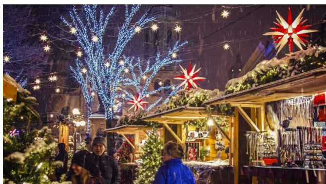
Marché allemand de Québec

Les marchés de Noël au Québec : une belle tradition du mois de décembre!