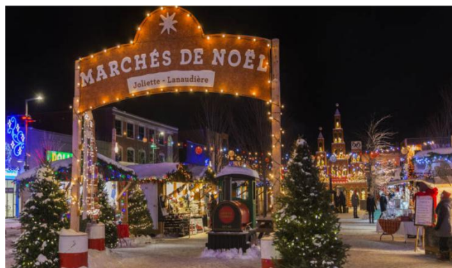
Marché de Noël de Joliette