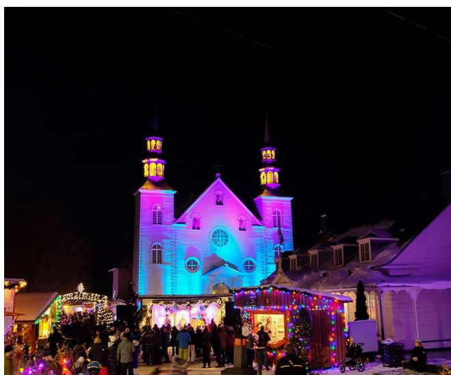
Marché allemand de Cap Santé