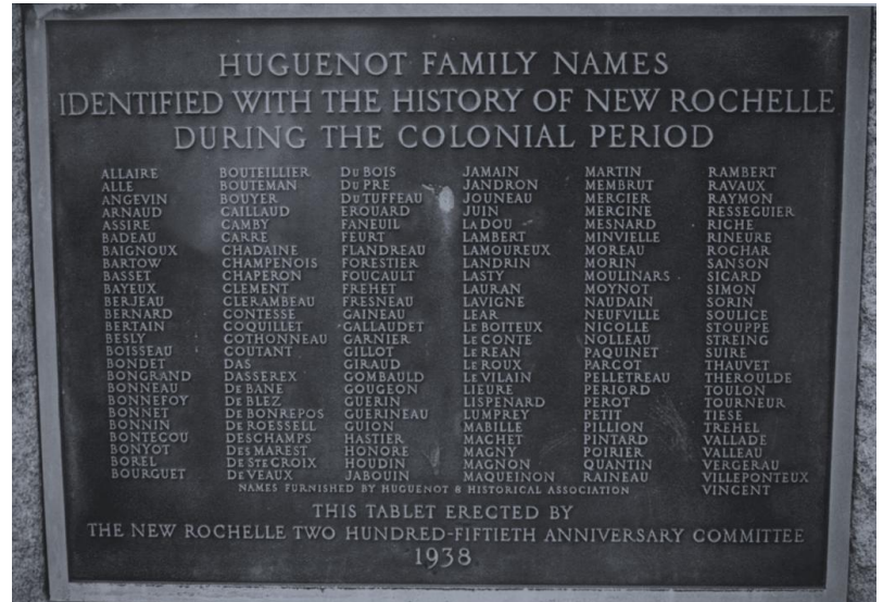
Plaque identifiant les chefs de famille huguenots de New Rochelle