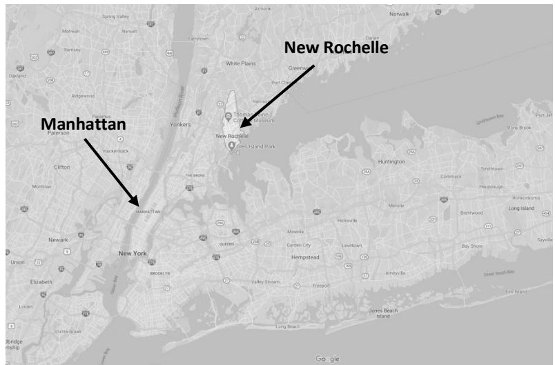
Localisation de New Rochelle par rapport à New York

La communauté de la Nouvelle Rochelle a été fondée en 1688 par une trentaine de famille provenant de la ville de La Rochelle, en France. Pourquoi ces Français se sont-ils installés en Nouvelle-Angleterre? Comme mentionné dans le Boisé 128, de nombreux Français ont quitté la France pour l'Amérique après 1685, suite à la révocation de l'Édit de Nantes et la reprise des persécutions religieuses envers les protestants.