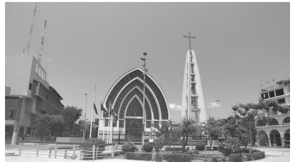
Plaza-de-armas, Pucallpa, Pérou